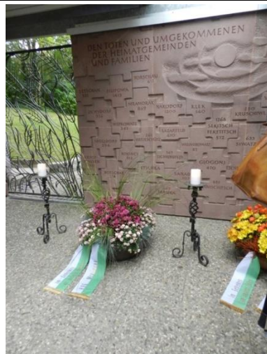
Erinnerung an unsere umgekommenen Mramoraker Landsleute