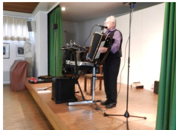
(hier Aufnahme Kirchweih 2005)